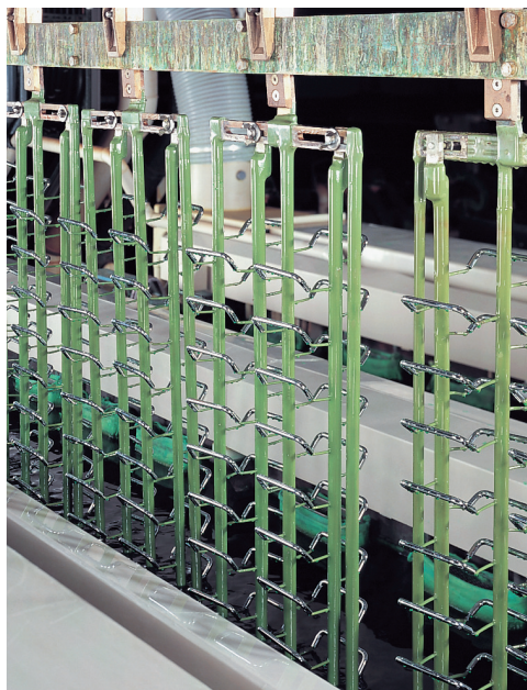
Werkbild: Rohde Rund-Stahlgriffe Typ ST im Galvanoautomat nach dem Vernickeln Picture made by: Rohde Round steel rod handles typ ST after nickel plating in the automatic electroplating plant