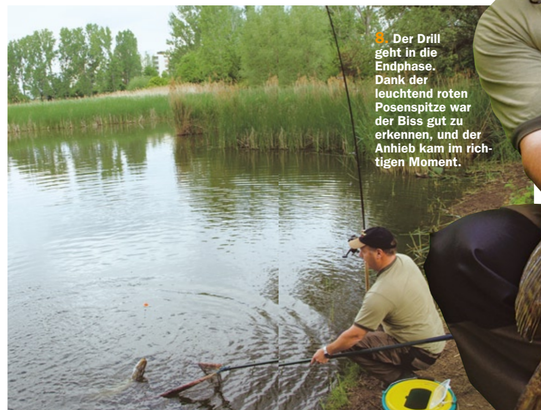
8. Der Drill geht in die Endphase. Dank der leuchtend roten Posenspitze war der Biss gut zu erkennen, und der Anhieb kam im richtigen Moment.

Jeden Monat begleiten wir erfahrene Spezialisten 'live' ans Wasser.