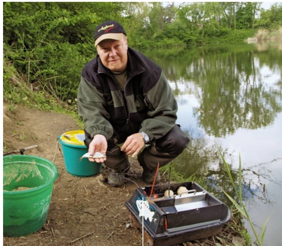
5. Wie aber bekommt man die Montage an diese etwa 50 Meter entfernte Stelle, ohne dass durch das Aufklatschen der Pose und des Köders die Fische verschreckt werden? Die Antwort lautet: Mit einem elektrischen Futterboot. In die aufklappbaren Futterluken wird die Pose gelegt. Vorfach und Köderfisch müssen draußen bleiben, damit es bei der Ausfahrt keine Verwicklungen gibt. Auch ein paar Stippfutterbälle gehören mit ins Boot und an die Angelstelle. Das fördert die Aktivität der Beutefische.