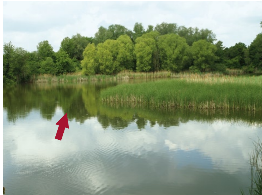
4. Einige Meter links von der Spitze des Schilfgürtels (Pfeil) hat Stefan am vorigen Abend einen Platz mit Stippfutter präpariert. Das lockt die kleinen Weißfische an, und in ihrem Gefolge kommen auch die Hechte.