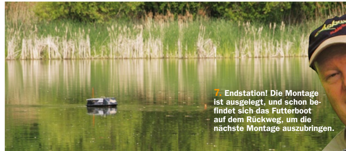
7. Endstation! Die Montage ist ausgelegt, und schon befindet sich das Futterboot auf dem Rückweg, um die nächste Montage auszubringen.