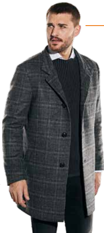
32002 MANTEL | 31979 PULLOVER | 31872 HEMD