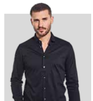
[NOS] NEVER OUT OF STOCK 30076 HEMD 69,95€ 31578 HEMD 59,95€