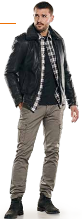
31876 LEDERJACKE | 31985 LONGSLEEVE | 31959 HEMD