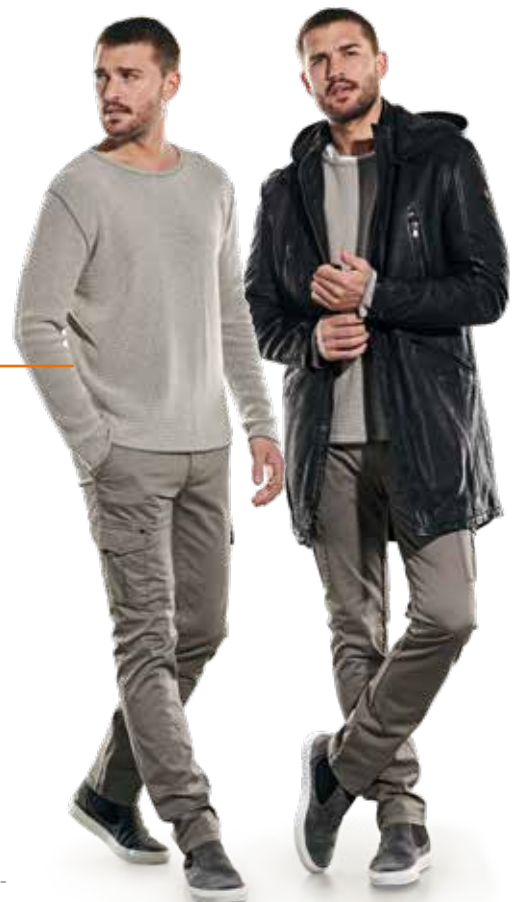
31995 CARGO-HOSE | 32160 PULLOVER | 31874 LEDERMANTEL

Stoffe verleihen pflanzliche Alternativen dem Leder in einem aufwendigen Verarbeitungsprozess seine Langlebigkeit.