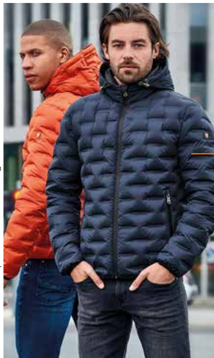
31860 JACKE Blau | 31859 JACKE Orange