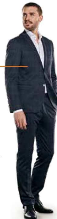
32081 ANZUGSAKKO | 32082 ANZUGHOSE