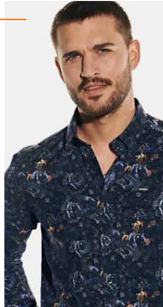
31957 HEMD in Baby-Cord

Individuelle Muster erkennt man auf den 1. Blick. Doch was steckt dahinter? Hochwertige Baumwolle ist die Basis der emilio adani-Hemden. Sie passen sich flexibel maskulinen Bedürfnissen an. Jetzt steht Männern die Entscheidung bevor: 100 % Baumwolle verarbeitet zu softem Baby-Cord oder bequemer Comfort-Stretch-Anteil? Eines ist sicher: Hemden von emilio adani heben Männer-Outfits von der Masse ab.